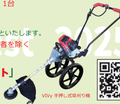
VIVy 手押し式草刈り機

応募先：チラシ裏面 または ホームページ https://vivy.jp/photocon をご覧ください。 問合せ：株式会社 ASALITE (アサライト) 電話 0584-36-0066 メール photocon@asalite.co.jp